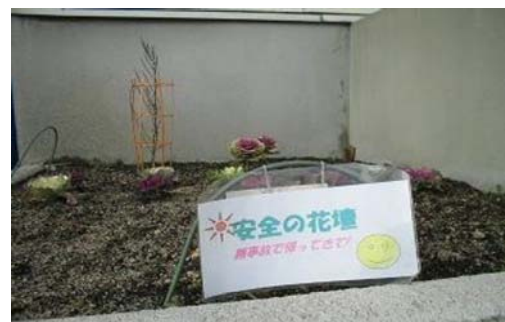
「安全の花壇」を作成して乗務職が交代で 世話をする