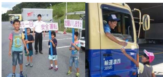
ご家族にご協力いただいて門前督励を実施