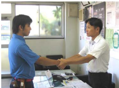
点呼実施時に握手で送り出す

というフローで展開してまいりました。それらは、「現場で課題と考えて出てきた対策事例」であり、非常に説得力があります。ここでは、その一部を紹介します。