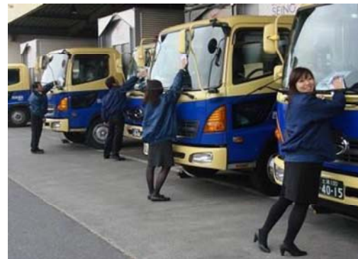
出発前の窓拭きに事務所員も参加して 労いの気持ちを込めて行なう