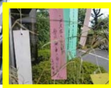
七夕にあわせて、ご家族や 本人たちで書いた安全祈 願の短冊を吊るす