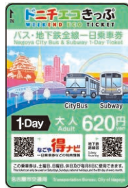
ドニチエコきっぷ