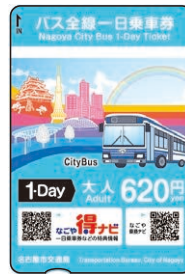
バス全線一日乗車券