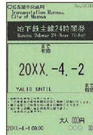
地下鉄全線24時間券