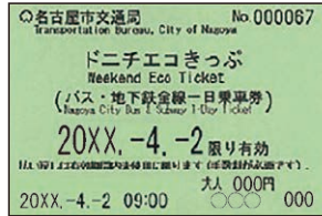
ドニチエコきっぷ