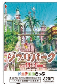
ジブリパーク開園 ドニチエコきっぷ

※令和2年度～4年度は、新型コロナウイルス感染症の影響により一部発売を見送りました。