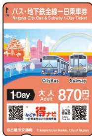
バス・地下鉄全線一日乗車券