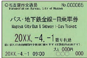
バス・地下鉄全線一日乗車券