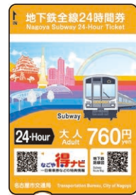
地下鉄全線24時間券