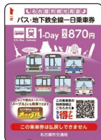
名古屋市観光周遊 バス・地下鉄全線一日乗車券