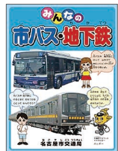
みんなの 市バス・地下鉄 (子ども向け)