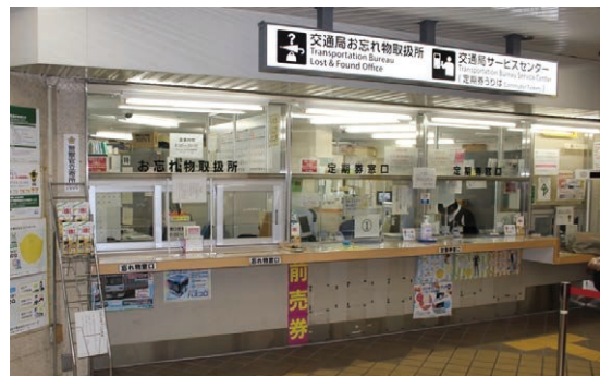
交通局お忘れ物取扱所

☎ (052) 959 - 3847 営業時間 9時～20時 （12月31日、1月3日は10時～17時） 休業日 1月1日・2日