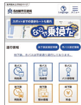
スマートフォントップ画面