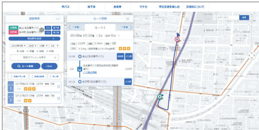
「なごや乗換ナビ」検索経路のルート表示

また、訪日外国人の方に対応するため、英語・中国語（繁体字・簡体字）、ハングル、ポルトガル語、スペイン語、フィリピン語、タイ語、ベトナム語のページを公開しています。