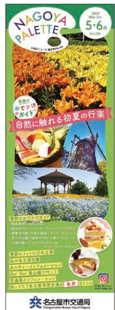
なごやパレット (交通局ニュース)