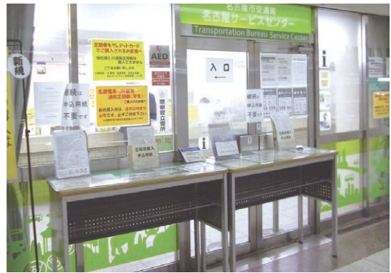
交通局サービスセンター（定期券うりば）

定期券をはじめ、各種乗車券を販売しています。 名古屋駅、栄駅、金山駅の3か所で営業しています。