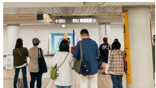
Nagoya POP UP ARTIST