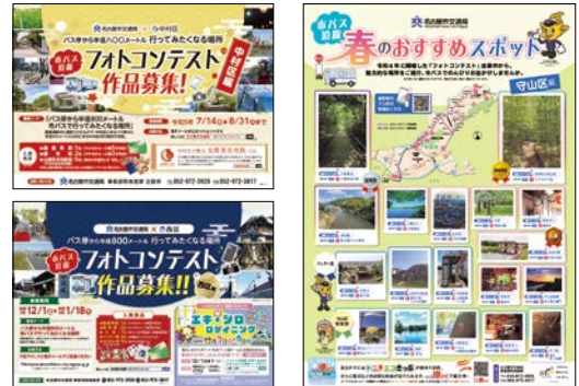
作品募集ポスター