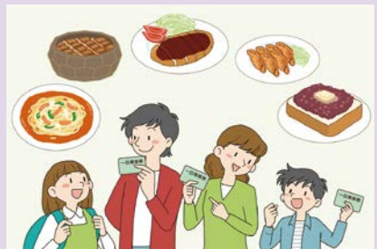
「グルメチケット付き企画乗車券（仮称）」