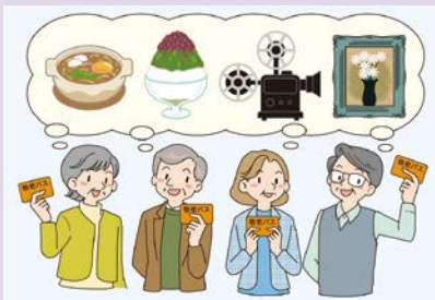
「アクティブシニアキャンペーン」