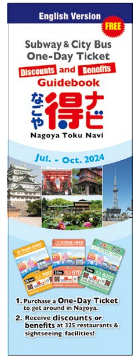
英語版なごや得ナビ