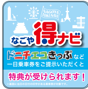
なごや得ナビ提携店ステッカー

また、外国人観光客向け情報の充実を図るため、「なごや得ナビ」の英語版冊子を発行し交通局ウェブサイトに掲載しています。