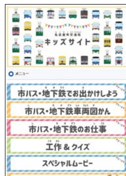
キッズサイトトップ画面