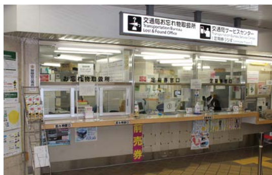
交通局お忘れ物取扱所