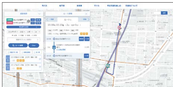
「なごや乗換ナビ」検索経路のルート表示