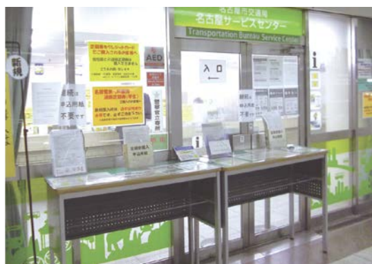
交通局サービスセンター（定期券うりば）

定期券をはじめ、各種乗車券を販売しています。 名古屋駅、栄駅、金山駅の3か所で営業しています。