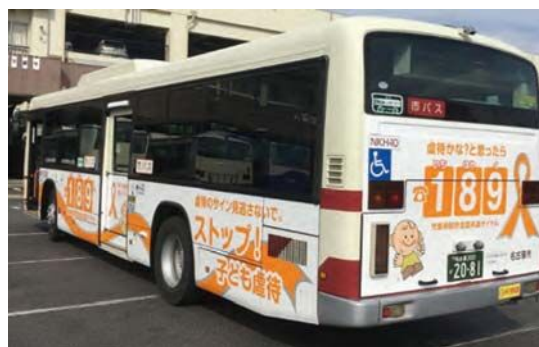
ラッピングバス広告

また、新しい媒体として車内にデジタルサイネージ広告を設置するための準備を進めています。