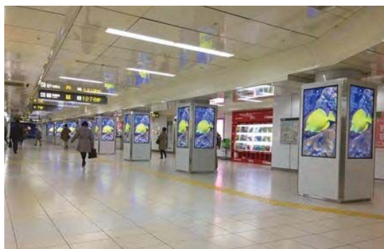
栄駅スクエアビジョン広告