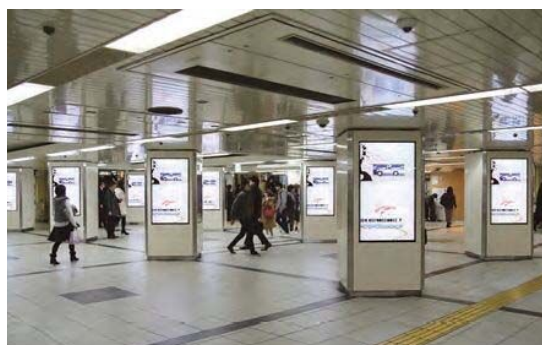
名古屋駅スクエアビジョン広告