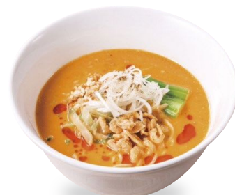
▲濃厚ごま担々麺 芳醇なゴマのkokと香りが自慢。 干し海老の食感も人気。