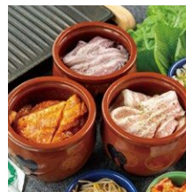
▲骨付きデジカルビ 1,958円(税込)