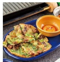
▲牛すじチヂミ 748円(税込)