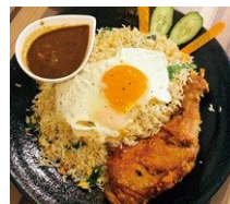
▲フライドライス 野菜たっぷりの 長粒米のチャーハン