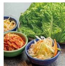
▲包み野菜食べ放題 440円(税込)