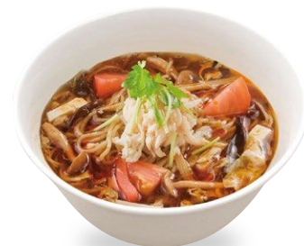
▲蒸し鶏ときのこのサンラー麺 酸味と辛味の絶妙なバランス! お酢パワーで疲れを癒し、パワーチャージを。