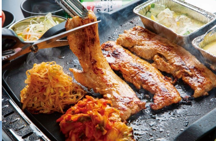
▲ベジテジセット(全9品) 2,970円(税込)

人気のサムギョプサル3種が楽しめる王道コース。個性豊かなサムギョプサルと、ベジテジならではのオリジナルトッピングと一緒に包んで味わう充実のラインナップ。韓国食文化には欠かせない本場のスープorチゲや、♨の定番「済州御飯」までついた大満足コースです。