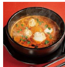
▲スンドゥブチゲ 1,078円(税込)