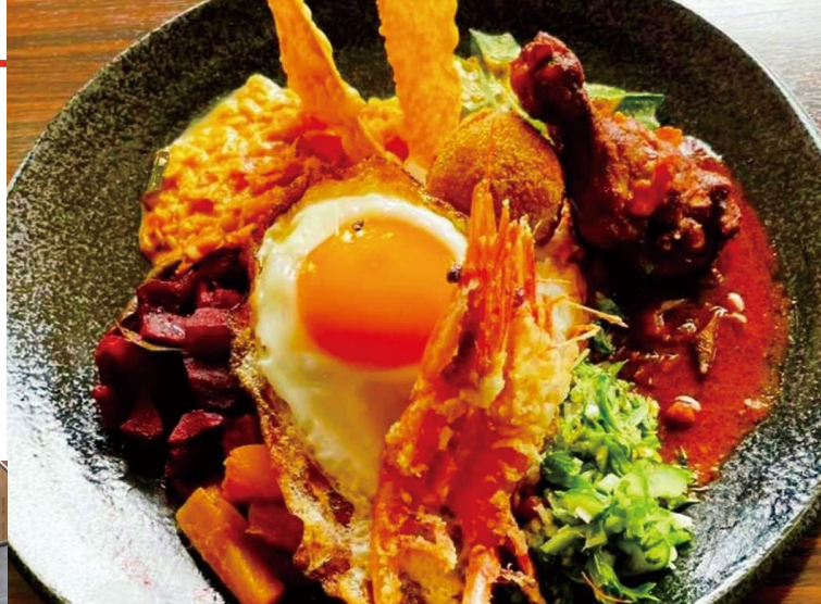
▲スペシャルセット カレーやおかずなど10種類をご飯に盛りつけ(日替り)