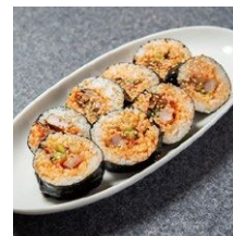
▲ブルゴギと野菜のキンパ 858円(税込)