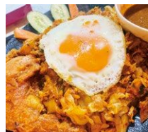
▲コッター ロティを細切りにして、 鶏肉・野菜と炒めた料理