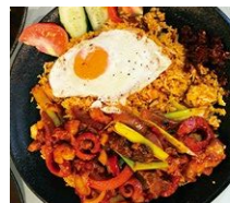
▲ナーシグラン インドネシア発祥の焼き飯