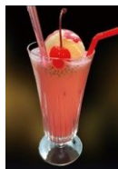
▶ファルダ デザートのような ドリンク