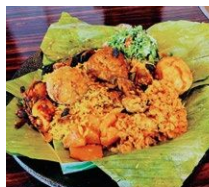
▲ラムプライス 炙って香りを出したバナナの 葉っぱで包んだごはん